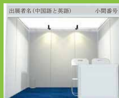
パッケージブースイメージ図